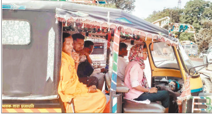
सवारियों से भरी आँटो चलाती गैंग की महिला चालक।