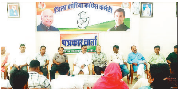
जिला कांग्रेस कमेटी कोरिया द्वारा रविवार को राजीव भवन स्थित कांग्रेस कार्यालय में जिला स्तरीय पत्रकारवार्ता आयोजित की गई।